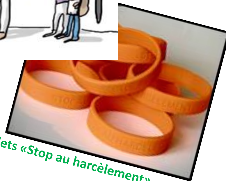
Bracelets «Stop au harcèlement»