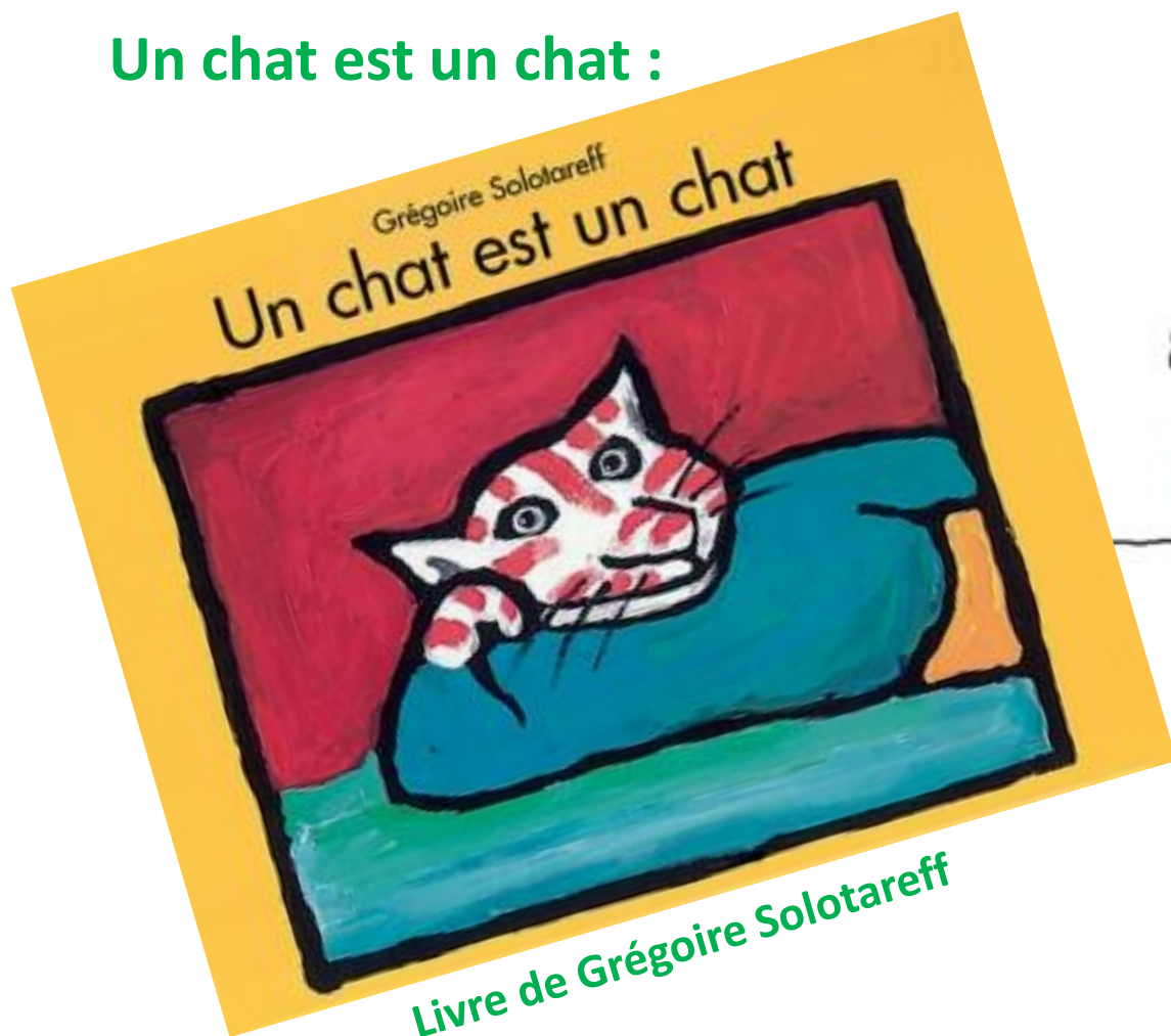
Livre de Grégoire Solotareff