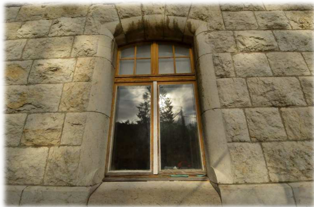
Fenêtres isolées avec des chiffons