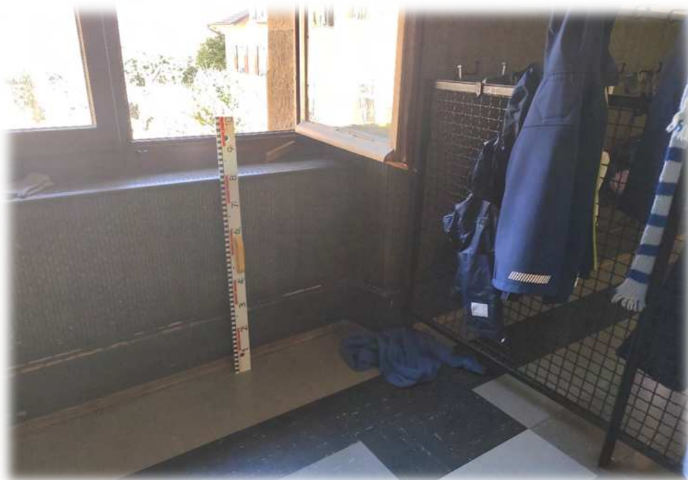
Hauteur de sécurité non respectée, crochets dangereux

CRÉDIT PHOTOS : EDEL MURCHIE (MARS 2021)