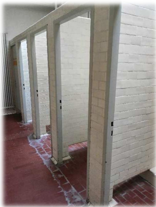
Douches à l'eau froide à la salle de gym