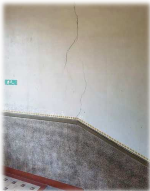
Nombreuses fissures, murs sales et peinture écaillée