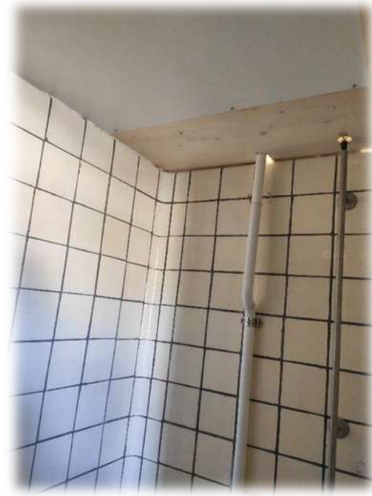
Réparation de fortune dans le but d'éviter l'effondrement des murets de séparation fissurés dans les sanitaires