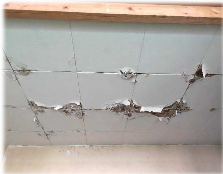
Plafond du local matériel de la salle de gym