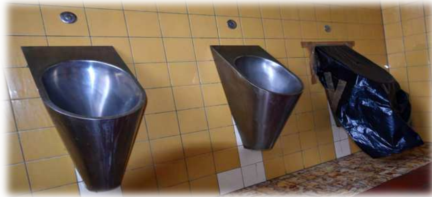
WC hors d'usage