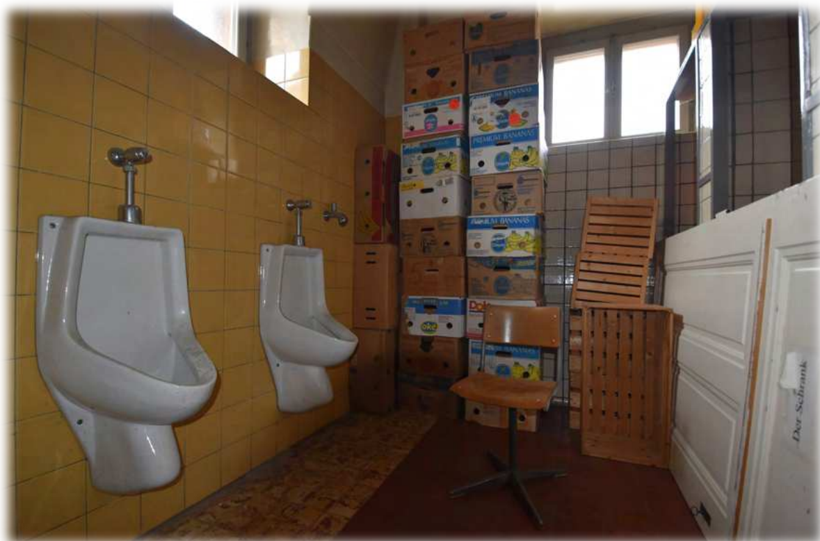
Sanitaires désaffectés servant de réduit