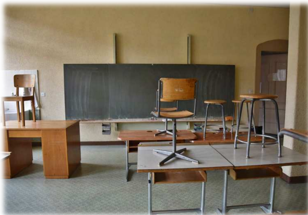
Mobilier désuet et en mauvais état, « remplacé uniquement si inutilisable »