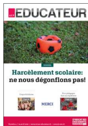
Chaque membre est abonné à la revue L'Éducateur