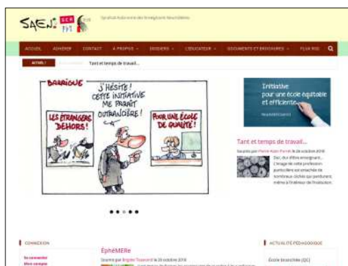
www.saen.ch le site du syndicat